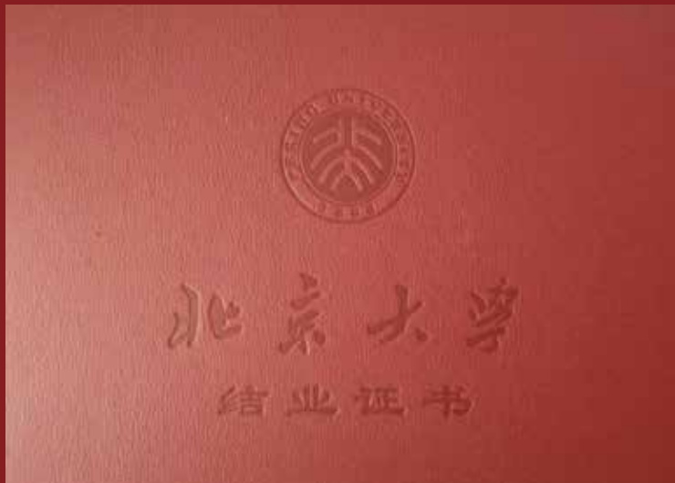
▲ 北京大学颁发的结业证书样本